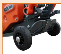
Kit de roues surbaissés amovible en option

Timon avec barre inférieure pour tirer facilement la plaque en arrière sans détériorer les enrobés.