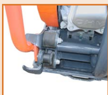
Vérrou de blocage du timon