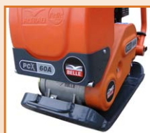
Rampe d'arrosage avec capot de protection métal