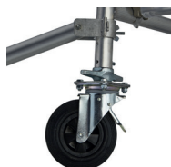
Système de liaison Ergoblock® breveté, blocage fiable d'un seul geste