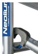
Roues diam. 200mm à blocage réglables sur 200mm et tous les 12,5mm