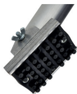
Plinthes 150 mm aluminium amovibles à mise en place rapide